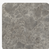
Szürke Sienna Márvány F095 ST87 Felületi struktúra: Ceramic