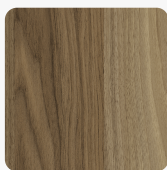
Cello Diófa 0811 FH Felületi struktúra: FH