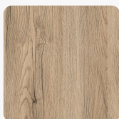
Krém Monaco Tölgy 624 FS22 Felületi struktúra: Natur Elegance